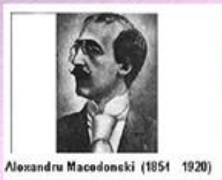
Alexandru Macedonski (1851-1920)