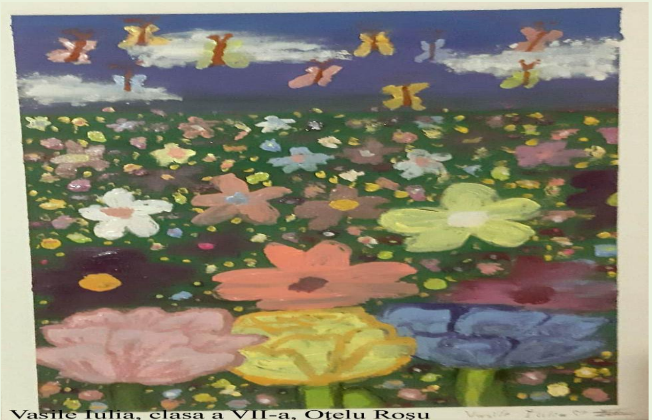
Vasile Iulia, clasa a VII-a, Oțelu Roșu

Anul VII, Nr. 3 (27) / 2022 / (Lunile: iulie – august - septembrie)