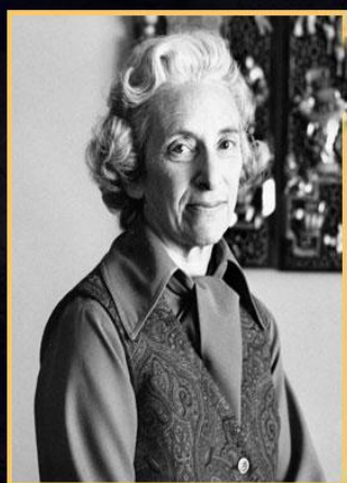
Barbara Tuchman Istorică

Anul VIII, Nr. 3 (31) / 2023 / (Lunile: iulie – august - septembrie)